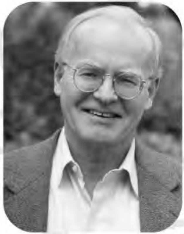
デヴィッド・レイ・グリフィン (David Ray Griffin) 1939年生まれ

1970年にクレアモント神学校で博士号を取得。師であるジョン・B・カブとともにプロセス神学の代表的な研究者として知られる。現在、クレアモント神学院名誉教授。退官頃から9・11事件をめぐる疑惑について調査と発言を始め、神学者らしい精緻さと謙虚さで、数々の著作を発表。“The New Pearl Harbor (邦訳『9・11事件は謀略か』)”